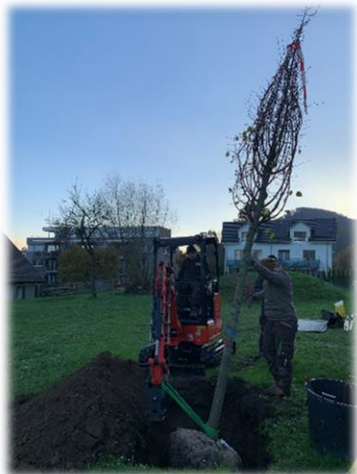
27. März 2023