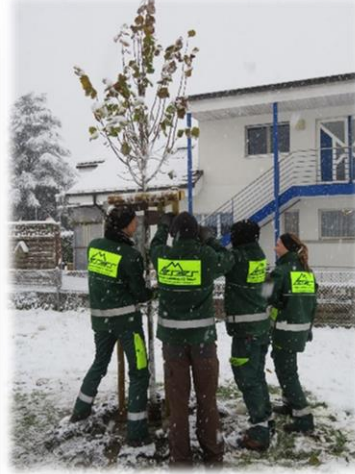
Schatten für Kinder und Klima